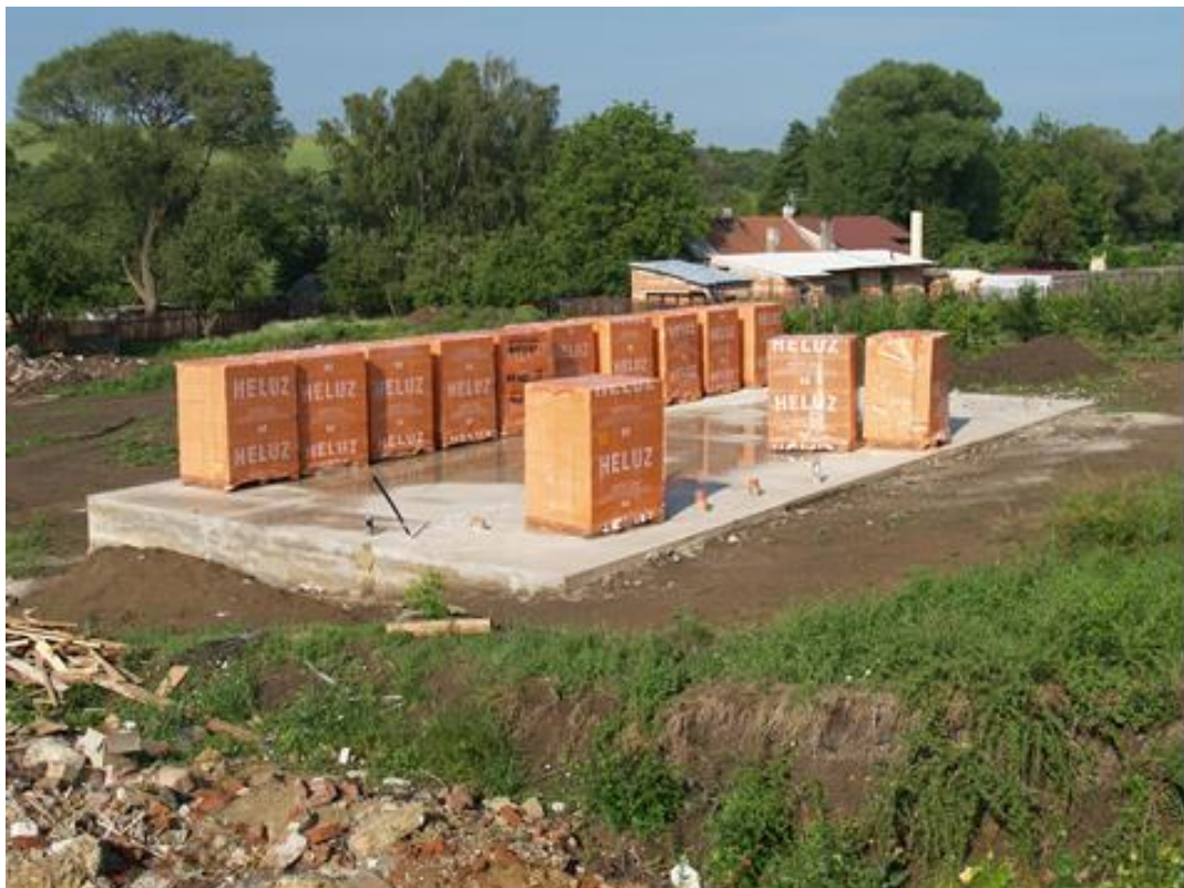
Složení palet z nákladního auta